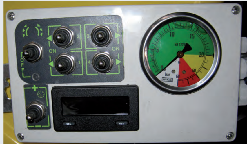
Druckmanometer mit elektrischer Teilbreitenbedienung