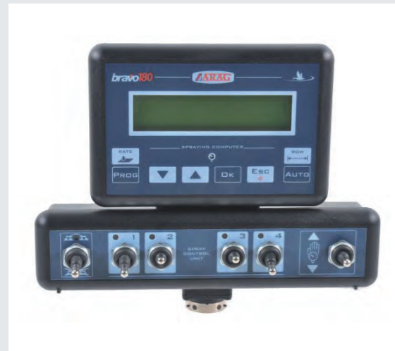
Spritzencomputer Bravo 180 für 2 oder 4 Teilbreiten