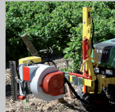
Der KMS Entlauber lässt sich wahlweise vorne, am Heck oder am Zwischenachspunkt befestigen.