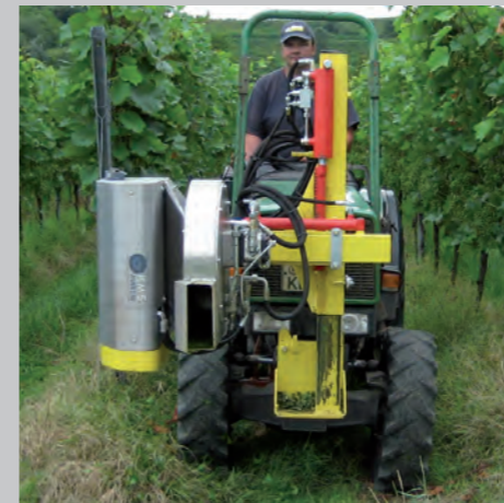
Der KMS Entlauber ist nicht nur ganz einfach einzusetzen, sondern auch besonders wartungsfreundlich.